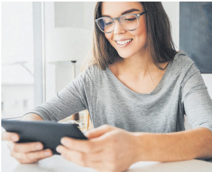
wise up ist die ideale Lösung, um mit E-Learning im Betrieb durchzustarten.